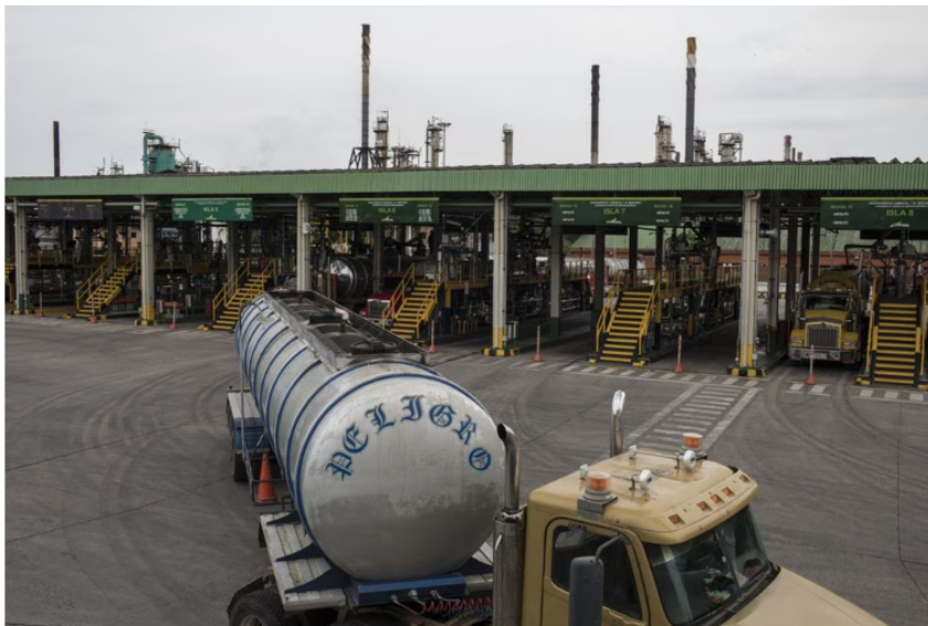
Un camión de transporte de combustible sale de las instalaciones de Ecopetrol en Barrancabermeja (Santander), en 2018.

El presidente Gustavo Petro ha difundido este miércoles que las autoridades de Colombia investigan un caso de robo de petróleo a la compañía mixta Ecopetrol , por una cifra que puede ascender a los 360.000 millones de pesos. En su cuenta de Twitter, el mandatario reveló el monto de la indagación que llevan a cabo la Dirección de Investigación Criminal e INTERPOL (DIJIN), la Unidad de Información y Análisis Financiero (UIAF), la Fiscalía y la Armada.