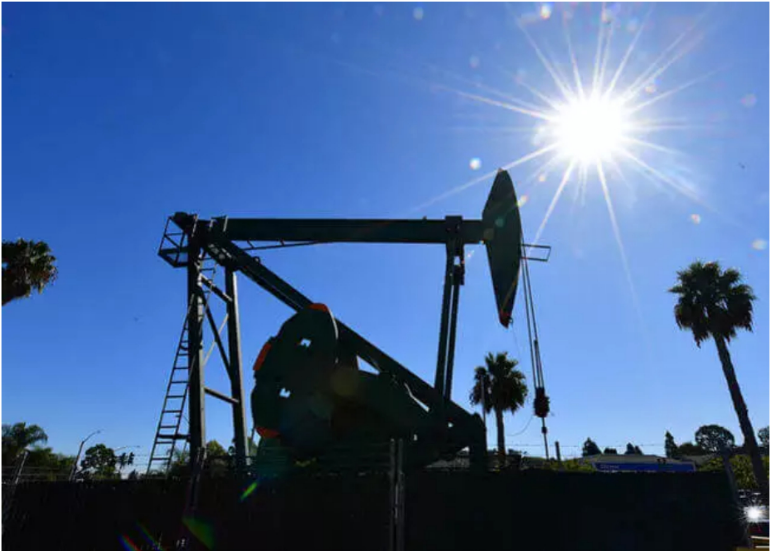
Petróleo referencia.