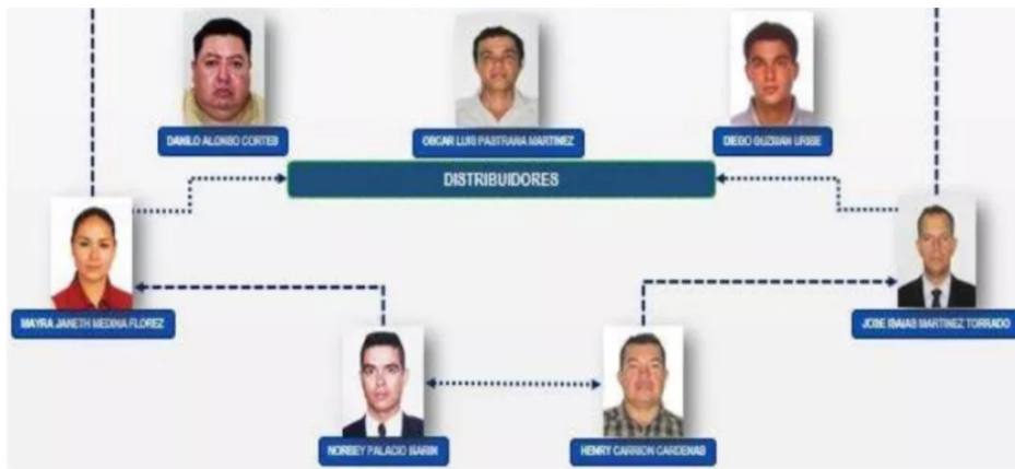
Integrantes de Holding Oil