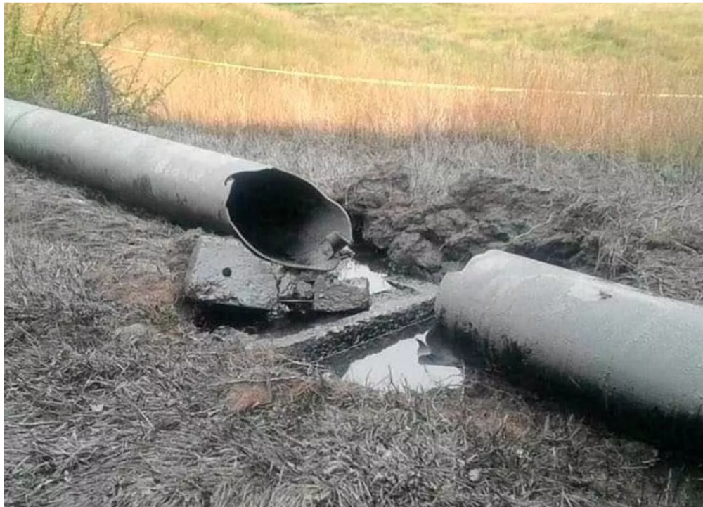
BLU Radio, referencia oleoducto

El transporte de este petróleo robado a Ecopetrol se realizaría en camiones cisterna con una capacidad de 12.000 galones y, luego de otro proceso, exportado a Europa, Singapur y otros lugares de Asia.