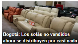
Bogotá: Los sofás no vendidos ahora se distribuyen por casi nada