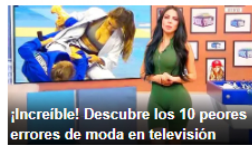
¡Increíble! Descubre los 10 peores errores de moda en televisión