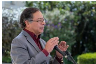
Petro anuncia que viaja a San Andrés para ratificar la soberanía de Colombia