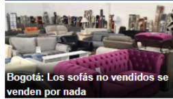
Bogotá: Los sofás no vendidos se venden por nada