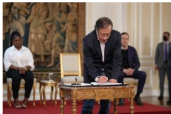
Petro sanciona ley "Dejen de Fregar", limitando horario de cobro de los bancos a usuarios