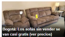
Bogotá: Los sofás sin vender se van casi gratis (ver precios)