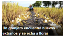
Un granjero encuentra huevos extraños y se echa a llorar