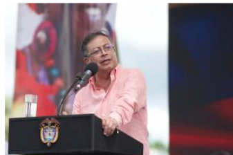
Petro amplía la suspensión de órdenes de captura contra disidentes