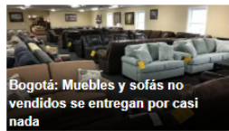
Bogotá: Muebles y sofás no vendidos se entregan por casi nada