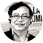
Gustavo Petro Presidente de la República

“El robo de petróleo a Ecopetrol solo en el caso investigado por Dijin, Uiaf, Fiscalía e inteligencia de la Armada puede alcanzar la cifra de $360.000 millones”.