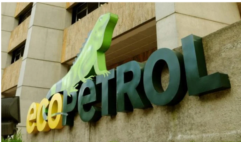
Construcción de gasoducto de Ecopetrol en el offshore se retrasaría por consultas previas.

Recientemente, se conocieron las intenciones de las empresas -como Ecopetrol - y el Gobierno Nacional de reactivar e impulsar la exploración y explotación de hidrocarburos en el Caribe colombiano, así como de la construcción de infraestructura que transporte los energéticos.