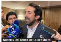
Noticias Del Banco De La República

Wingo inició su ruta Bogotá-Caracas; tiene en la mira más destinos