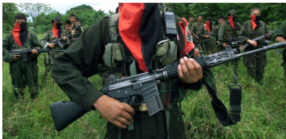
Pablo Beltrán, cabecilla del ELN, aseguró que la guerrilla continuará con las actividades de financiamiento y secuestro pese al cese al fuego pactado.

A las 6 y 10 minutos de la mañana, ¿qué estará opinando María Isabel hoy martes 25 de julio en SEMANA? Pues la opinión gira en torno a que ahora le vamos a salir a deber al ELN, no solo no ha dejado sus actos terroristas en diversos lugares del país sin que se pronuncie ninguno