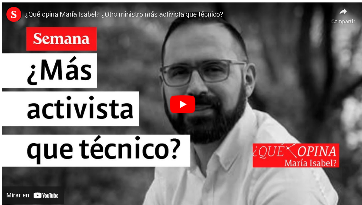
La opinión gira en torno al nombramiento del nuevo ministro de Minas, en reemplazo de la cabecita con tenis Irene Vélez.