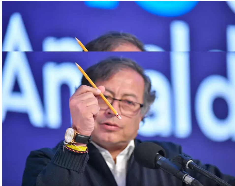
Presidente Gustavo Petro