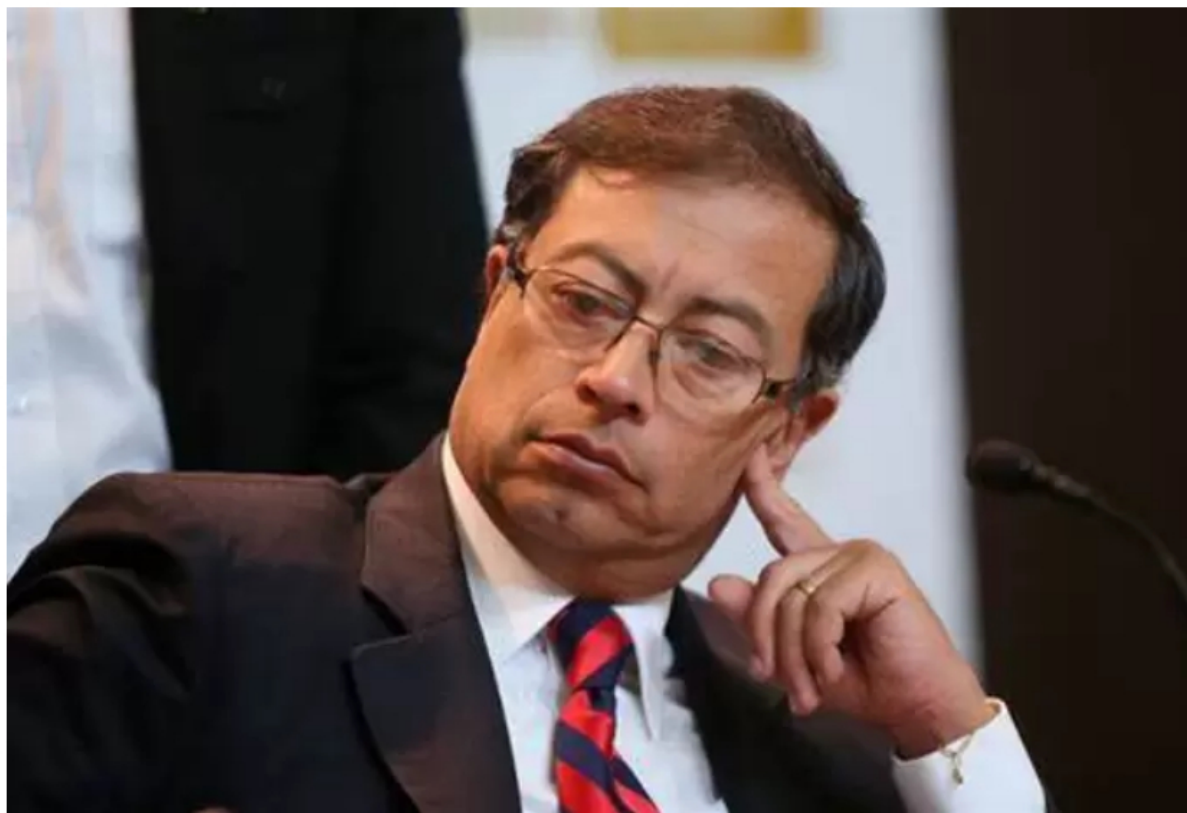
protestas presidente Gustavo Petro