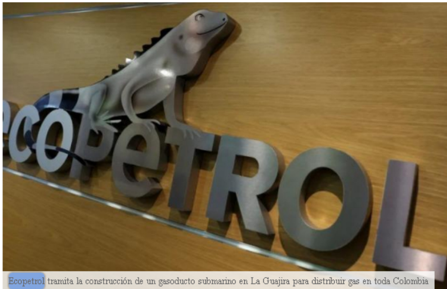
Ecopetrol tramita la construcción de un gasoducto submarino en La Guajira para distribuir gas en toda Colombia

Lo que está previsto es crear un gasoducto que vaya desde Orca hasta la plataforma marina Chuchupa B para tratar el gas y distribuirlo al resto del país.