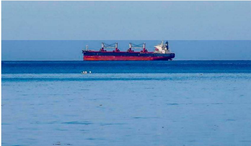
El petróleo venezolano era exportado por El Caribe en cargueros colombianos.

Traficaban crudo venezolano y petróleo robado por el ELN, desde empresas legales.