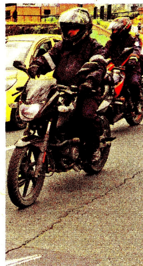
Según la Adres, se requieren $450.000 millones. CEET

El director de la Adres, manifiesta que este sector