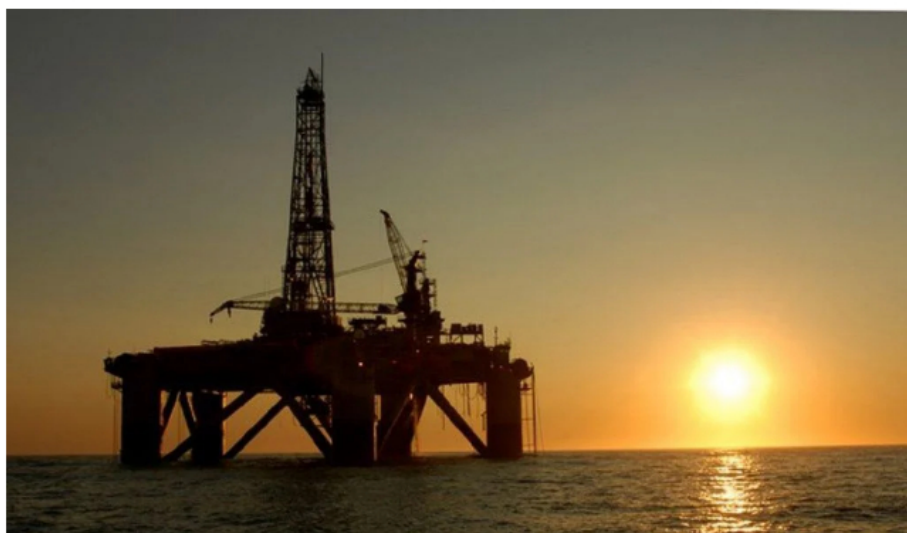
Gobierno Petro fija reglas para aprovechar mejor pozos de petróleo y gas.

inactividad conforme con la información aportada por el operador.