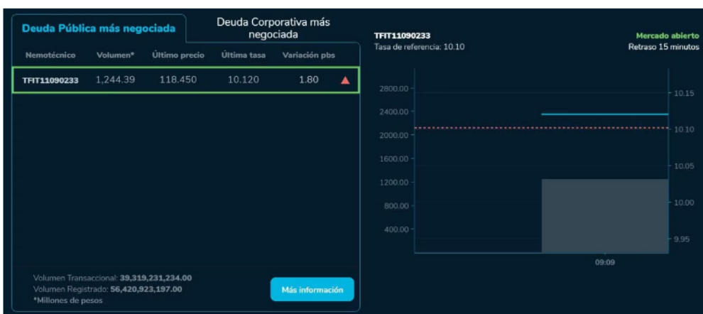
La Bolsa de Valores de Colombia y Ecopetrol arrancaron una nueva semana con la mira puesta en recuperarse de la mala racha que mostró en días pasados y este lunes -24 de julio comenzaron la jornada con nuevos repuntes en su cotización.

El movimiento en la BVC está influenciado por varios factores, entre ellos, las expectativas sobre la política monetaria de la Reserva Federal de Estados Unidos, ya que los inversores aguardaban con atención el anuncio que realizará esta institución en la próxima semana. Los movimientos en las tasas de interés y las políticas económicas de Estados Unidos pueden tener un impacto significativo en el tipo de cambio del peso mexicano, debido a la estrecha relación comercial y financiera entre ambos países.