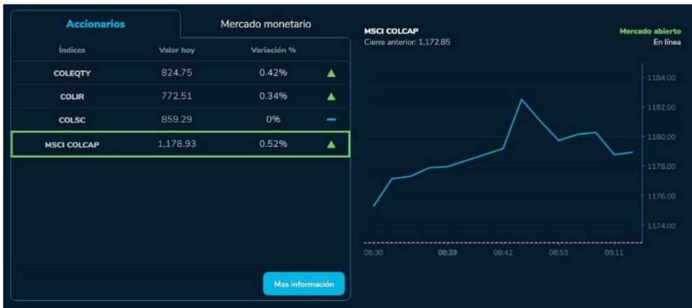
De acuerdo con los reportes de cierre para esta oportunidad, el índice MSCI Colcap se ubica por ahora en 1.178,93 unidades, creciendo de esta forma un 0,52 % respecto a las 1.172 que marcan la referencia.

ahora en 1,178,93 unidades, creciendo de esta forma un 0,52 % respecto a las 1,172 que marcan la referencia. Este indicador empezó el día en terreno positivo y rápidamente ha llegado a máximos de 1,182 unidades; impulsadas principalmente por las acciones del sector industrial y pese a que luego vivió un ligero desplome, todavía se mantiene con buenos reportes y expectativas de crecer una vez más.