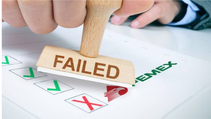
Para Fitch, todos los gobiernos de la región, con excepción de México, lograron implementar diferentes medidas para garantizar el perfil crediticio de sus petroleras.

Por Héctor Usla julio 24, 2023 | 13:58 pm hrs