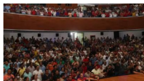
Pemex 'no da una': Trabajadores rechazan 'miserable' propuesta de aumento salarial

La Empresa Nacional del Petróleo de Chile es la petrolera mejor evaluada por parte de Fitch Ratings, ya que cuenta con una calificación de A- con una perspectiva estable, lo que ubica a esta empresa con la calificación más alta de la región y con una alta solvencia.