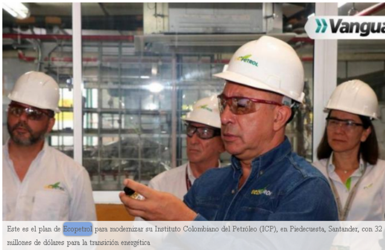
Este es el plan de Ecopetrol para modernizar su Instituto Colombiano del Petróleo (ICP), en Piedecuesta, Santander, con 32 millones de dólares para la transición energética

32 millones de dólares, es decir, al menos $133 mil millones, invertirá Ecopetrol en la modernización del Instituto Colombiano del Petróleo (ICP), ubicado en Piedecuesta, y en su infraestructura tecnológica, desde ahora hasta 2026.