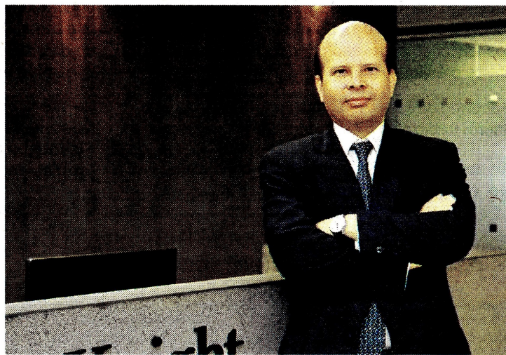
Holland & Knight

Esa claridad también se materializa en los contratos y permite que la seguridad jurídica también fortalezca la posición de los inversionistas.