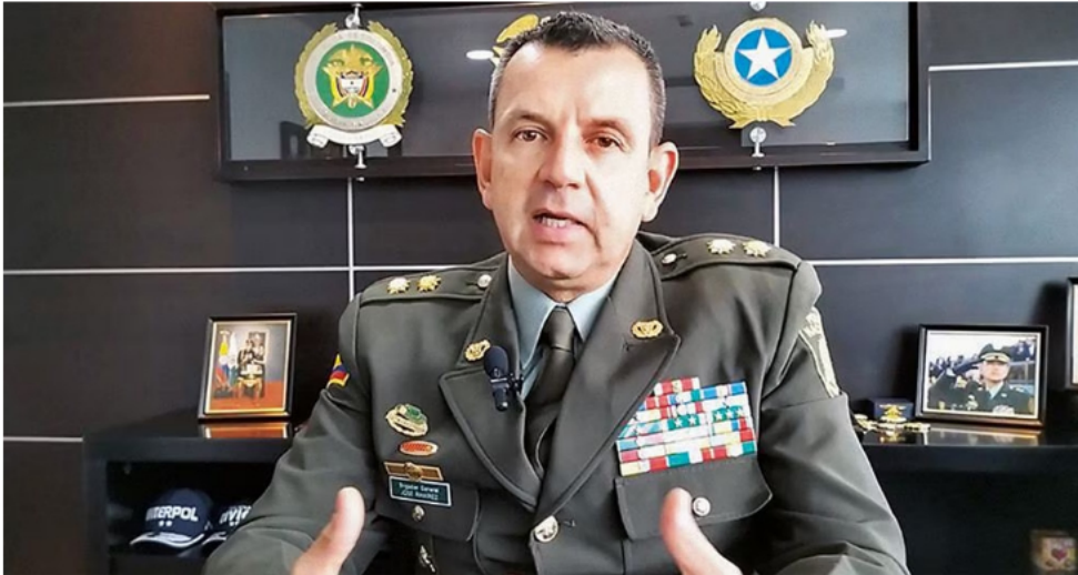
El director de la Dijin, el general José Luis Ramírez, anunció mano dura contra las empresas que se prestan para mezclar actividades legales con ilegales, como el caso del buque cisterna.

La historia de este barco y otras naves que quedaron a disposición de la Sociedad de Activos Especiales (SAE) es bastante particular. El buque cayó en una megaoperación de la Policía y la Fiscalía contra el contrabando de hidrocarburos, en la cual la principal víctima era Ecopetrol . La empresa se vio afectada por el robo continuado de petróleo, unos 60.000 millones de pesos, desde su mismo oleoducto a través de la modalidad de barbaqueo (poner válvulas en el oleoducto para robar el hidrocarburo).