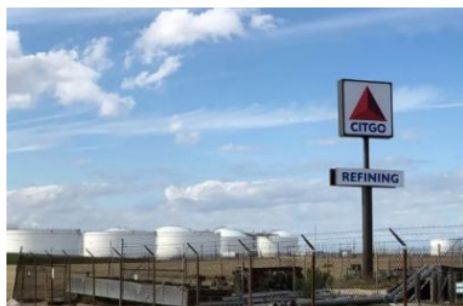
Citgo recibe petróleo de países vecinos de Venezuela

Los registros de importación de crudos de la empresa de refinación Citgo, filial de Petróleos de Venezuela (PDVSA) en Estados Unidos, indican que, para el mes de abril, cerrando el primer cuatrimestre de 2023, hubo un promedio de compra de crudo colombiano a la empresa estatal Ecopetrol por el orden de los 32.500 barriles diarios, de acuerdo a la data de la Agencia de Información de Energía (EIA por sus siglas en ingles).