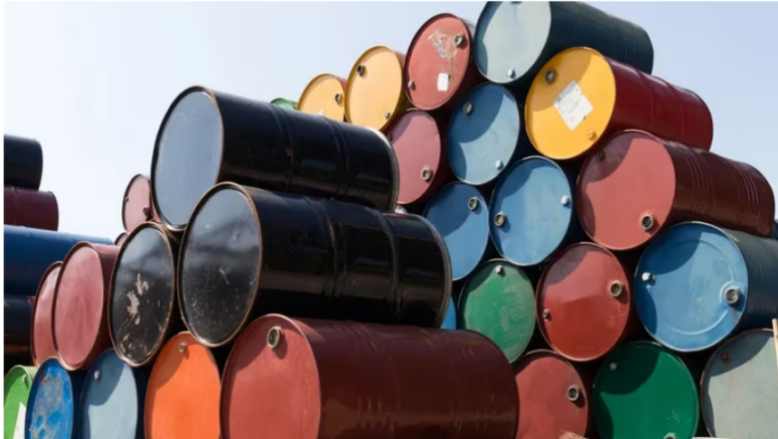
Imagen referencial. Los barcos petroleros con bandera de Panamá se cargaron en puertos ubicados en la costa Caribe y tenían como destino final Singapur, Ámsterdam y otras ubicaciones en Asia y Europa.

Estos barcos transportaban una carga mensual equivalente a un millón de barriles de petróleo colombiano, valorada en cerca de 10 millones de dólares, pero que no aparecía registrada en los registros de exportación.