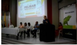
Barrancabermeja se prepara para la 4ª Feria Distrital del Libro "Déjame Leer en Paz"