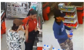
ACTUALIDAD / 3 semanas ago Imágenes revelan al presunto autor del homicidio en D1 de Barrancabermeja