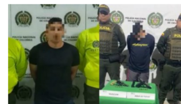
JUDICIAL / 5 meses ago Estos son los Capturados presuntos responsables del homicidio de niña de 13 años