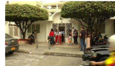
JUDICIAL / 5 meses ago Muere una niña de 15 años al ingresar al colegio Bethlemitas