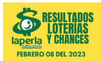
AZAR / 5 meses ago Resultados de chances y loterías del 8 de febrero del 2023