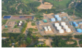
Empresas locales luchan por oportunidades de contratación en La Cira Infantas