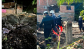
Ecopetrol se pronuncia sobre manipulación de válvulas de pozo petrolero