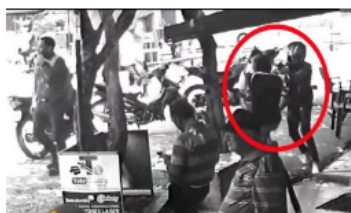
ACTUALIDAD / 5 meses ago Impactante video del ataque sicarial en el corregimiento El Centro