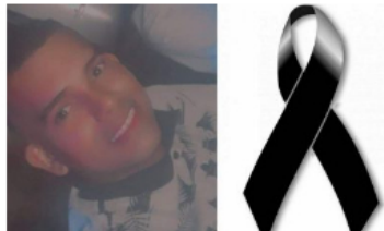
ACTUALIDAD / 5 meses ago Segundo asesinato en menos de 24 horas en Barrancabermeja