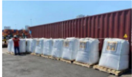
Ecopetrol exporta primer cargamento de asfalto a Chile y se consolida en el mercado internacional