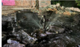
Manipulación de válvulas por terceros ocasionó daño ambiental