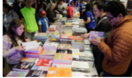
Gran lanzamiento de la feria del libro ¡Déjame Leer En Paz!