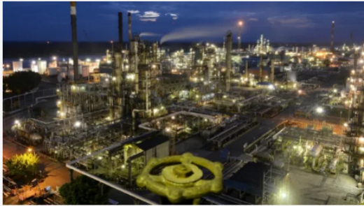
Refinería de Ecopetrol .