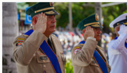
General Helder Giraldo: "Es prematuro hablar del fin de la guerra", refuta afirmación de presidente Petro