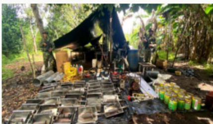
Fuerza Pública evidencia nueva modalidad para el transporte de estupefacientes