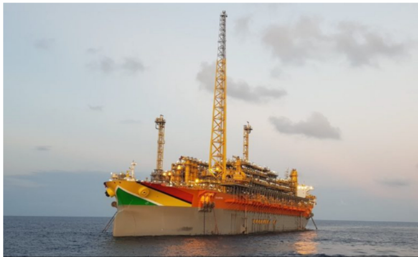
Barco con bandera de Guyana transporta petróleo extraído del margen costero del país amazónico.

Publicado el 20/07/2023 09:00 | Editado 20/07/2023 06:52