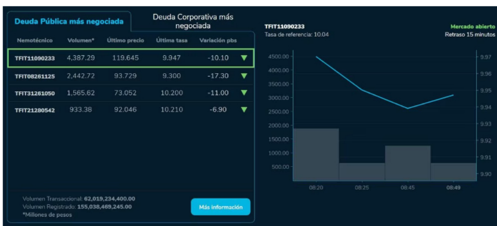
En lo que concierne a los mercados de renta fija, estos sí mantienen un crecimiento muy fuerte y se ubican con saldos a favor.

La noticia del día corre por cuenta de las ventas minoristas en Estados Unidos fueron peores a lo esperado en junio, según datos del gobierno divulgados el martes, con un consumo que crece, pero por debajo de los pronósticos, a pesar de que la inflación se modera. Las ventas minoristas crecieron 0,2 % con respecto a mayo, a 689.500 millones de dólares, indicó el Departamento de Comercio.