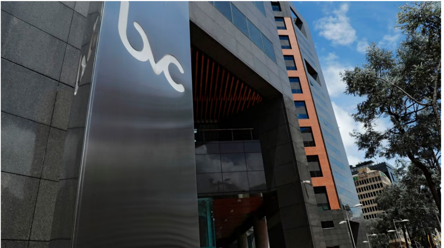
Gran parte de los indicadores en este mercado se dispararon en el arranque.

La Bolsa de Valores de Colombia y Ecopetrol siguen luchando por salir de la racha de resultados negativos que viene mostrando desde mediados de la semana pasada, y este martes 18 de julio comenzaron la jornada con varios repuntes en sus indicadores, en medio de un ambiente de expectativa que hay entre los inversionistas tras los datos de crecimiento económico en China y repunte de la industria manufacturera en los Estados Unidos, donde también se revisan los reportes de ventas minoristas que por ahora muestran un crecimiento que tranquiliza a los mercados.