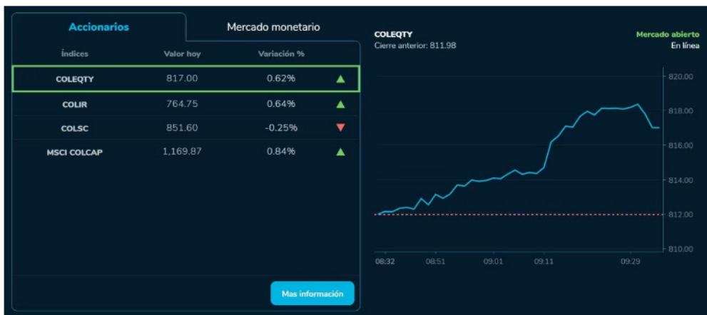
La Bolsa de Valores de Colombia y Ecopetrol siguen luchando por salir de la racha de resultados negativos que viene mostrando desde mediados de la semana pasada.

empezo a crecer, impulsada principalmente por las firmas del sector industrial y financiero, que también muestran un dinamismo que favorece a los operadores y disminuye la aversión al riesgo en esta plaza.