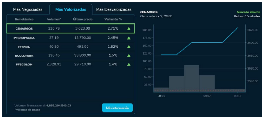
Los mayores desplomes son para Terpel (-1,37%), Canacol Energy (-1,13%) y PEI (-0,33%).

Los precios del crudo tuvieron su segunda jornada consecutiva de caída este lunes, en un mercado que duda cada vez más de la reactivación china sin medidas de apoyo por parte del gobierno. El precio del barril de Brent del mar del Norte para entrega en septiembre cedió 1,71 % a 78,50 dólares en Londres, mientras que el West Texas Intermediate (WTI) para entrega en agosto perdió 1,68 % a 74,15 dólares.