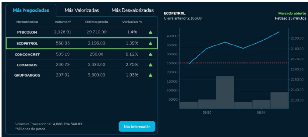
Ecopetrol vuelve a intentar un crecimiento pese a los desplomes de la cotización internacional del crudo en la sesión anterior.

Dando un vistazo al panorama internacional, la Bolsa de Valores de Nueva York, aplacada por un débil aumento en las ventas minoristas en junio en Estados Unidos, abrió ligeramente a la baja el martes, una sesión ocupada por los resultados bancarios. Luego de las primeras operaciones de apertura, el índice principal, el industrial Dow Jones, ganó un marginal 0,03 %, mientras que el Nasdaq, de base tecnológica, retrocedió 0,31 % y el índice ampliado S&P 500 -de las 500 empresas principales- retrocedió 0,15 %.