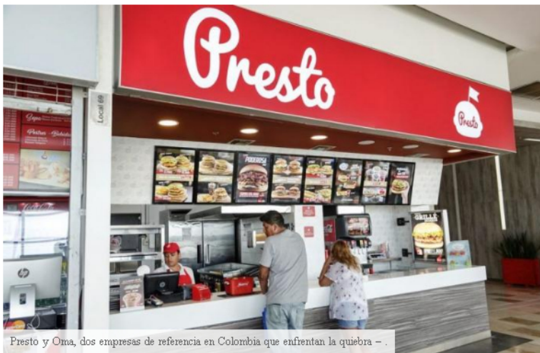
Presto y Oma, dos empresas de referencia en Colombia que enfrentan la quiebra - .

Presto, una de las hamburgueserías emblemáticas de Colombia durante más de cuatro décadas, mira hacia el precipicio financiero. La Superintendencia de Compañías, ente regulador de la mayoría de las empresas del país, informó el pasado viernes 14 de junio que acogió la solicitud de la empresa que maneja la cadena de comida rápida, así como la tradicional marca de café Oma, para beneficiarse de un proceso de reorganización empresarial. Un llamado de auxilio para dos empresas que han sido señas de identidad del paisaje de las ciudades y aeropuertos colombianos.