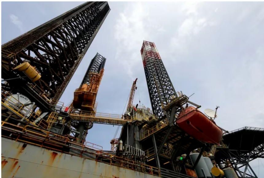
Gas natural en un pozo del Caribe colombiano.

La compañía Shell ha iniciado la perforación del pozo Glaucus en el Caribe colombiano , en la misma zona donde se realizaron los descubrimientos de gas natural de Kronos y Gorgon .