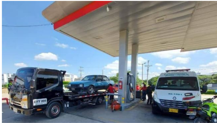
La Policía inspecciona en las estaciones.