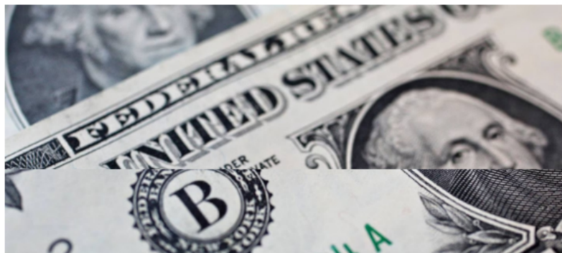
La Estrategia del Día: Dólar en Colombia sigue bajando: las razones.

Además, hablaremos de la inversión de Ecopetrol en transición energética y de la reorganización de Oma y Presto