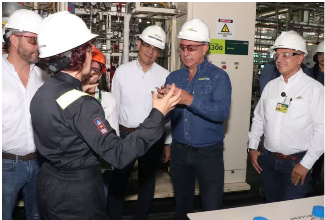
Ecopetrol hizo millonaria inversión en tecnología para Santander