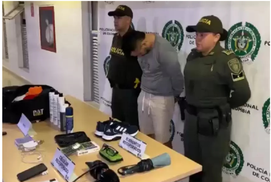
Abría las puertas con un control y robaba los carros en Bucaramanga