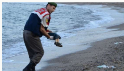
300 niños migrantes se han ahogado en el Mediterráneo en 2023