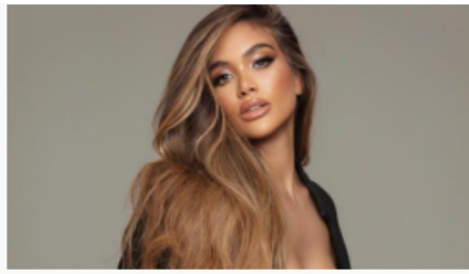
Exclusión en la elección de Señorita Bolívar 2023-2024