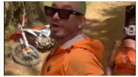
El accidente en moto del reguetonero J Balvin