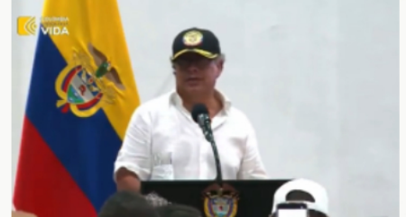
El presidente Gustavo Petro brilla por su ausencia en la reunión clave con el Pacto Histórico