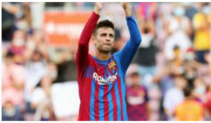
Gerard Piqué impulsa la expansión global de la Kings League con México y Brasil