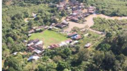
Reforma agraria y desarrollo rural: títulos de propiedad para familias campesinas en el Sur de Bolívar