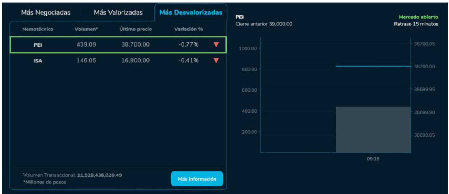
Los mayores desplomes son para PEI (-0,77 %) e ISA (-0,41 %).

Los precios del petróleo mantuvieron su tendencia alcista este miércoles 12 de julio, impulsados por el apetito por el riesgo tras la buena acogida de un indicador de inflación estadounidense. El barril de Brent del Mar del Norte para entrega en septiembre subió 0,89 % en Londres y cerró a 80,11 dólares, mientras que en Nueva York, el WTI en los contratos para agosto subió 1,22 % hasta 75,75 dólares el barril.