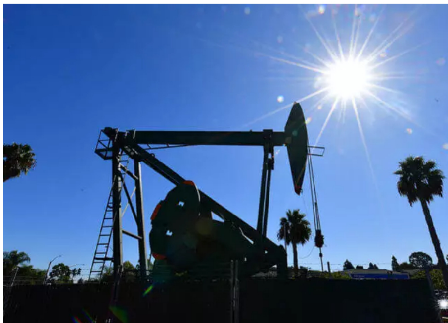
Blu Radio Petróleo

La concesión se termina en septiembre de este año, lo que obligó al Gobierno a buscar medidas para evitar que deje de producir.