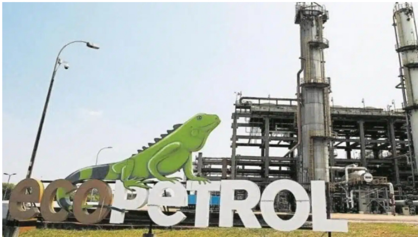
Logo de Ecopetrol frente a instalaciones.