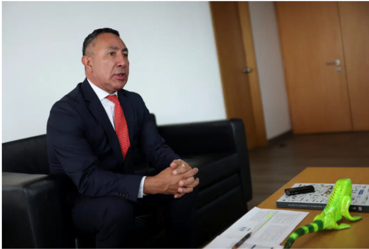
Presidente ejecutivo de Ecopetrol , Ricardo Roa.

“HISTÓRICAMENTE HEMOS TENIDO UN NIVEL DE FACTOR DE RECOBRO CERCANO AL 19%. LA META MÍA ES SUBIRLO EL 23%. CADA PUNTICO DE MEJORA EN EL FACTOR DE RECOBRO REPRESENTA PRÁCTICAMENTE UNOS 600 MILLONES DE BARRILES ADICIONALES EN LAS RESERVAS”, DIJO ROA EL MARTES EN UNA ENTREVISTA CON REUTERS EN SU OFICINA.