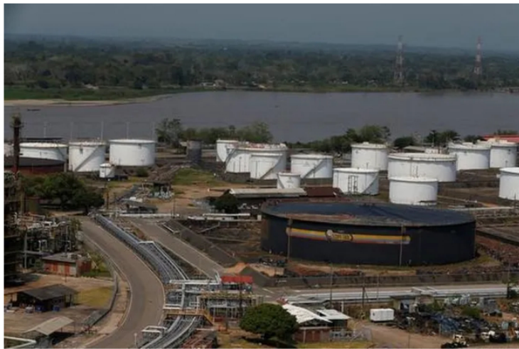
Foto de archivo. Imagen de la Refinería de Ecopetrol en Barrancabermeja, Colombia, 1 de marzo, 2017.