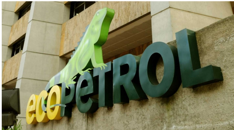
Sede de Ecopetrol