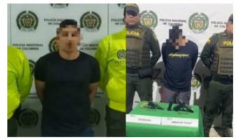
JUDICIAL / 5 meses ago Estos son los Capturados presuntos responsables del homicidio de niña de 13 años