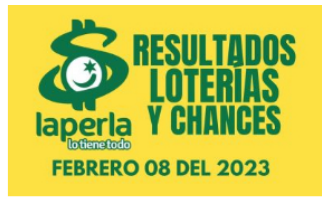
AZAR / 5 meses ago Resultados de chances y loterías del 8 de febrero del 2023