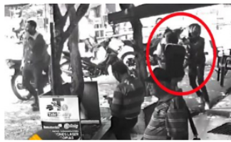
ACTUALIDAD / 5 meses ago Impactante video del ataque sicarial en el corregimiento El Centro