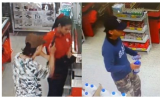
ACTUALIDAD / 2 semanas ago Imágenes revelan al presunto autor del homicidio en D1 de Barrancabermeja