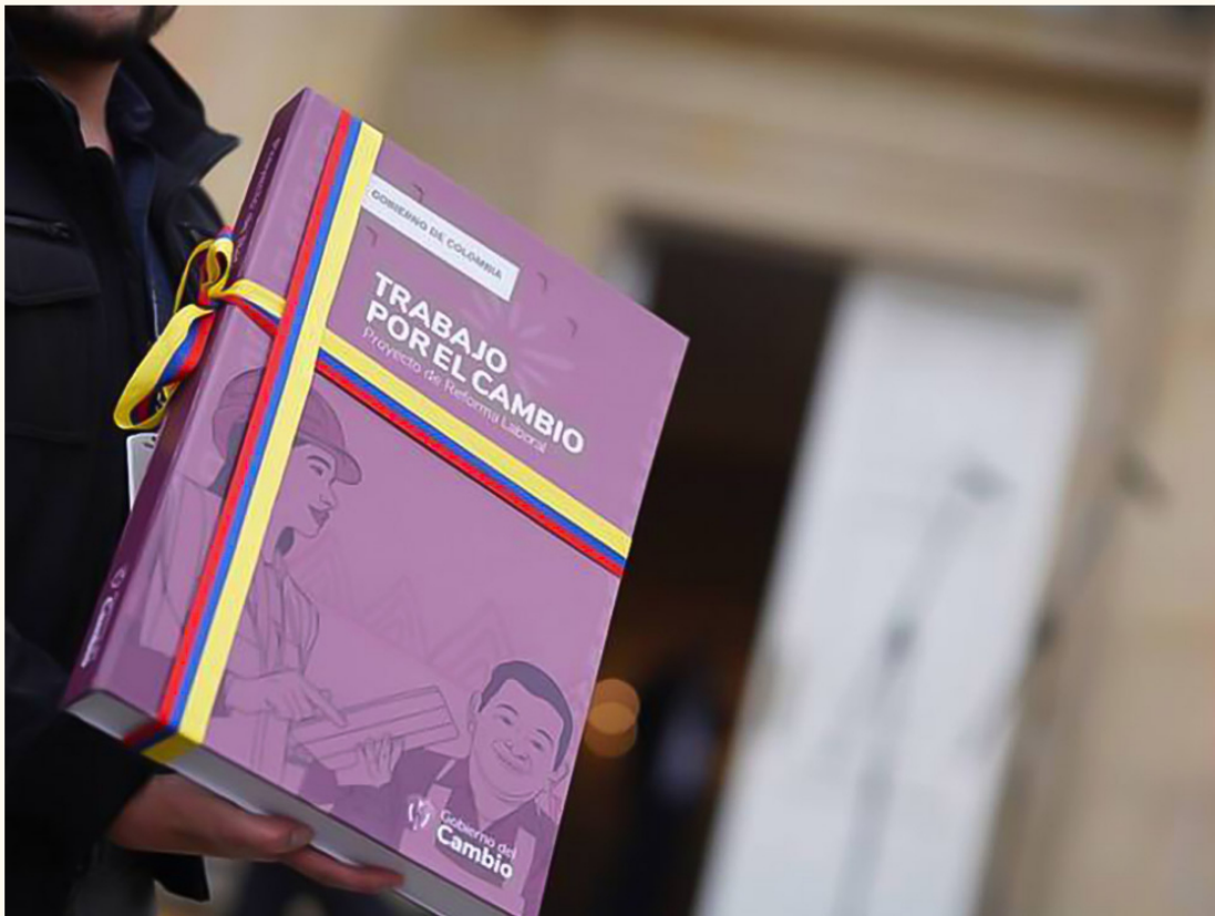
El proyecto de reforma laboral del Gobierno Petro ha generado reacciones y cuestionamientos entre diversos sectores del país.

Me explico un poco, podríamos generar un mecanismo mediante el cual los informales pudieran ir asumiendo extra costos laborales en forma paulatina, por ejemplo, a lo largo de 10 años, donde el primer año no asumen ningún extra costo, el segundo asumen solo el 10 % de lo que pagan los formales, y así poco a poco van subiendo su capacidad de pago. Todo esto en la medida en que toda la economía va reduciendo esos costos asociados que son tan pesados. Este mismo mecanismo lo propusimos para asumir el gran costo que implica la informalidad tributaria.