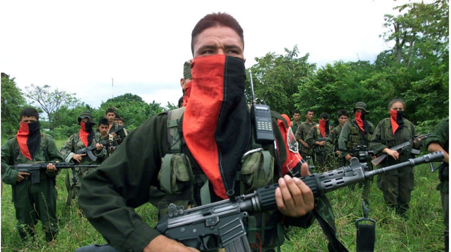
ELN aseguró que la guerrilla continuará con las actividades de financiamiento y secuestro pese al cese al fuego pactado.