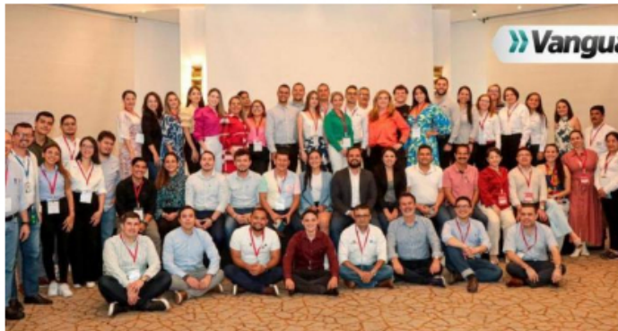
40 empresas santandereanas se fortalecieron con el proyecto Gestionar e Innovar ejecutado por la CCB – .

La Cámara de Comercio de Bucaramanga culminó con éxito el proyecto “Fortalecimiento de capacidades en gestión de la innovación del sector empresarial santanderino”, que benefició a 40 empresas santandereanas de los focos estratégicos de Santander: biotecnología, energía, salud, agroindustria y manufactura, mejorando su nivel de sofisticación y diversificación.