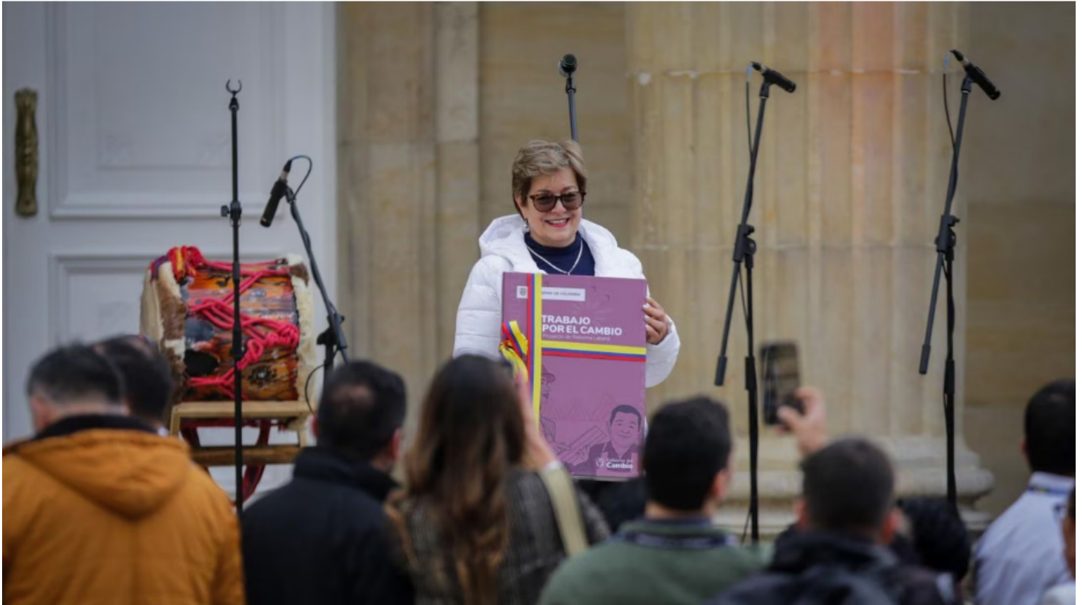
la reforma laboral se volvería a presentar este mes.