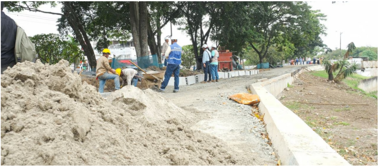
La construcción es una de las actividades que podrían verse afectadas.