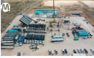
Ecopetrol y Oxy lograron producción récord de petróleo en el Permian