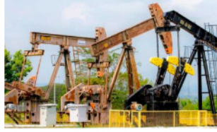
Ecopetrol aumentó presencia en el mercado asiático con ventas récord de petróleo