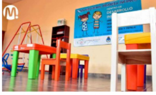
Ecopetrol invertirá $167.000 millones en 'Obras por Impuestos'