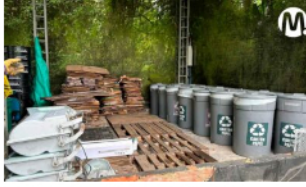
Más de 5.551 toneladas de residuos, aprovechó Ecopetrol el último año