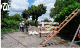
Ecopetrol mejorará 60 kilómetros de vías rurales en el Meta