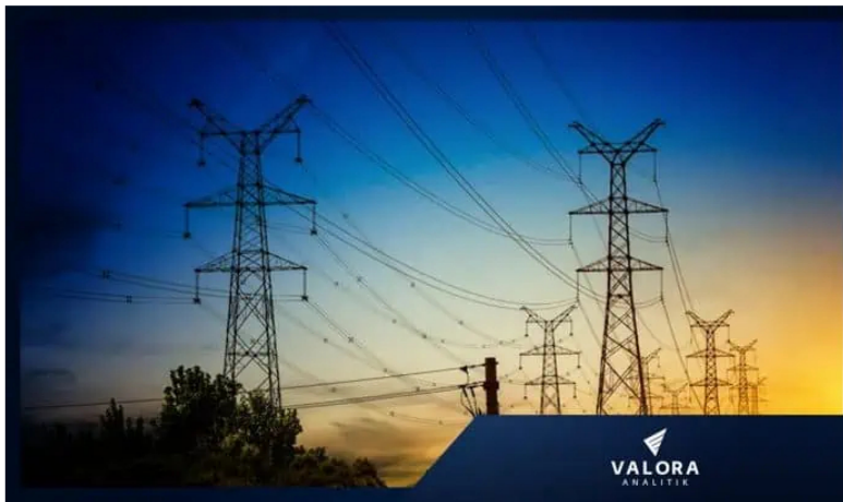
Gobierno Petro insiste en integración vertical entre Ecopetrol e ISA.

Como se conoce de meses atrás, el Gobierno de Colombia, encabezado del presidente Gustavo Petro, tiene entre sus planes sacar adelante la iniciativa de 'integración vertical' que busca que Ecopetrol se convierta en generador de energía y esté presente en todos los eslabones de la cadena.