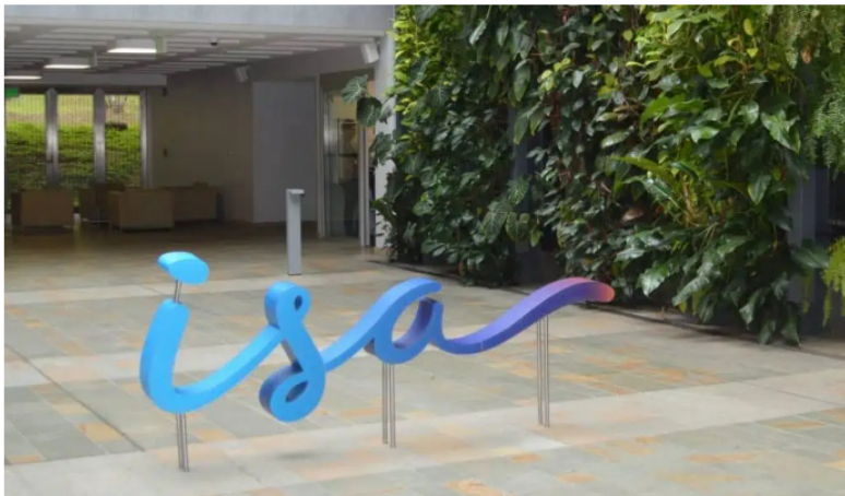
El artículo del PND permitiría que ISA realice otras actividades aparte de la transmisión de energía.

Pues en Colombia hay más de cinco empresas integradas verticalmente que participan en todas las actividades de este sector, las cuales ya existían al momento de expedición de las leyes que regulan el servicio de energía eléctrica (Leyes 142 y 143 de 1994) y que han mantenido su condición.