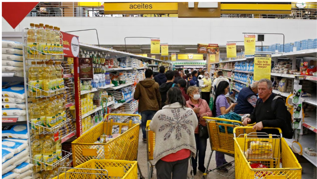
Grupo Éxito.

En medio del proceso de su posible venta, el Grupo Éxito continúa con sus planes para inscribir su acción en Wall Street y para eso, el lunes 3 de abril, radicó una solicitud pública de registro (Formulario 20-F) de Recibos de Depósito Americanos Nivel II (ADR II), que es como se conocen las acciones de empresas no estadounidenses que se transan en las plazas bursátiles del país del Norte.