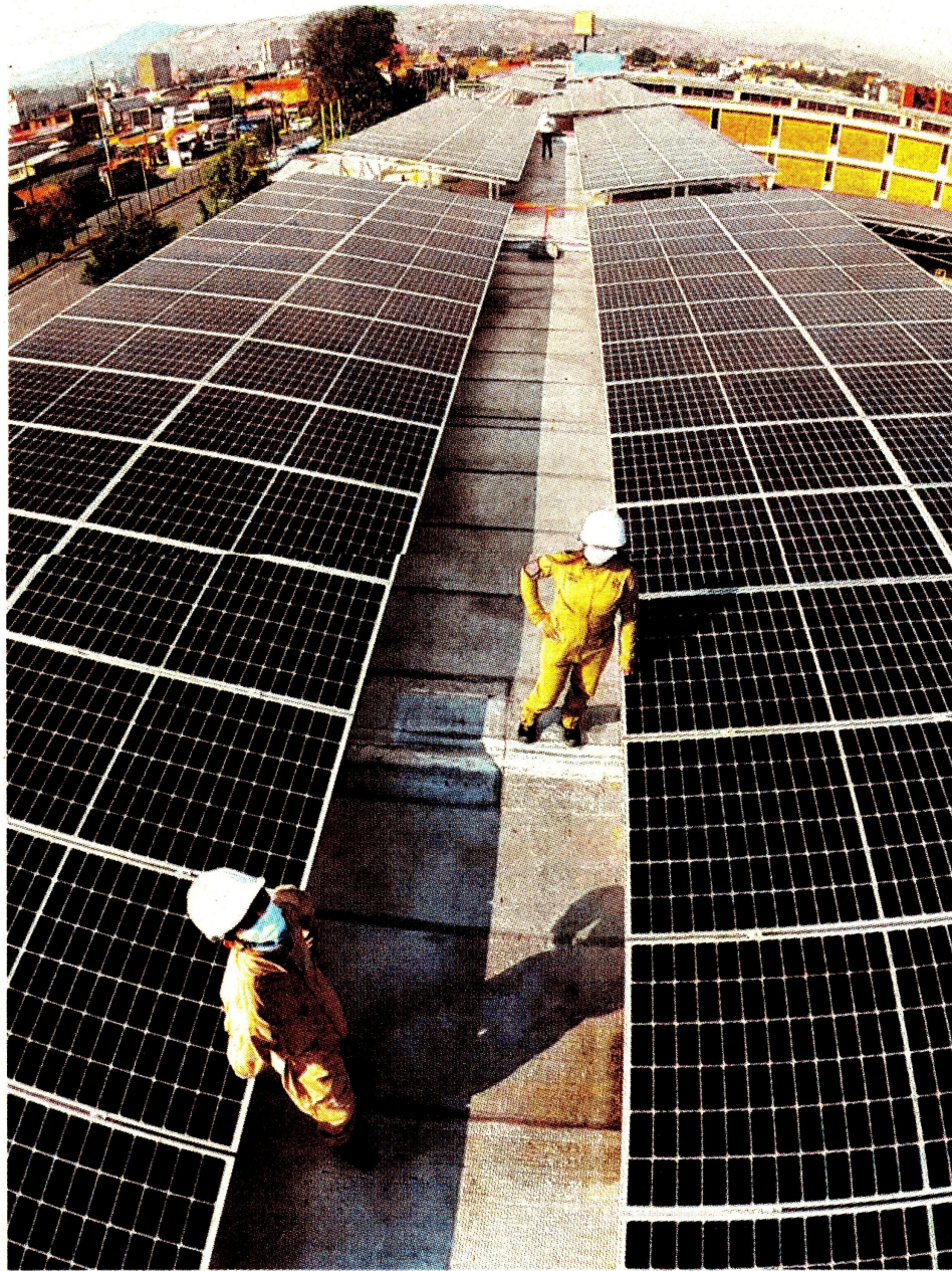
Un diseño ideal de un sistema energético lo importante es combinar las fuentes. CEET

Celsia tiene 11 líneas de producto definidas y dedicadas a la industria. Agrega que "tenemos más de 1.000 empresas que hemos asesorado en eficiencia energética y los ahorros consolidados de esas compañías ya están llegando a los $30.000 millones anuales. Sin duda, la energía solar es la que más aporta a ese ahorro. Una empresa cuando monta un sistema solar distribuido para su producción puede ahorrar en el costo energético