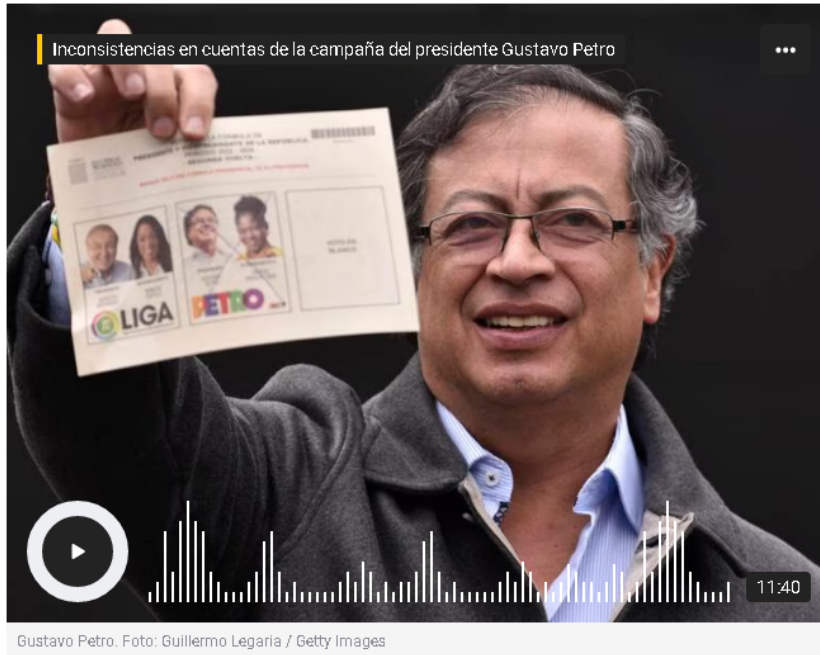
Gustavo Petro.