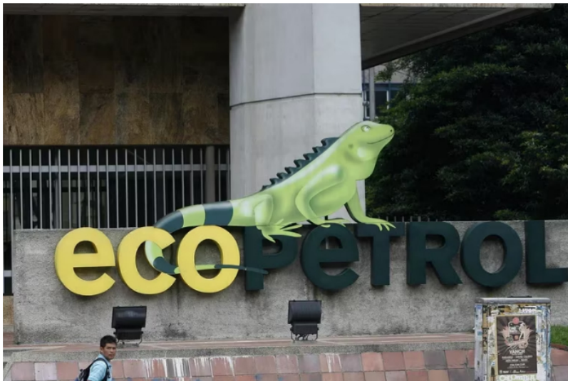
Los planes para la exploración están enfocados en, al menos, siete nuevos pozos ubicados en el Caribe.