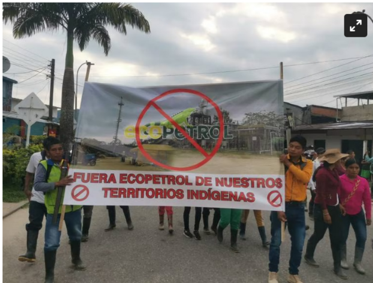
U'wa rechaza a Ecopetrol

Los campesinos y comunidad que habita en el municipio de Cubará pide que no se sigan afectando sus recursos por la explotación de petróleo.