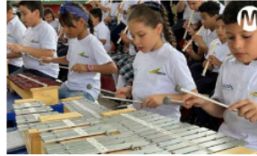
Ecopetrol y Batuta siembran la semilla de la música en niños del Meta