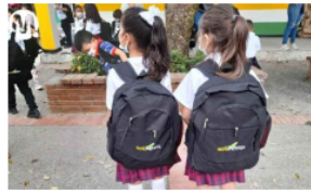
Ecopetrol entregará 19.823 kits escolares en el Meta