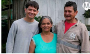
Con apoyo de Ecopetrol y UniAndes, 320 familias rurales metenses consolidan sus negocios