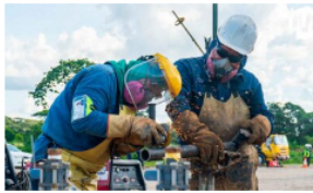
Ecopetrol generó más de 30 mil empleos en el Meta durante 2022