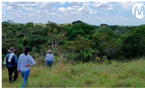
Ecopetrol contribuye a la protección de más de 1.700 hectáreas de bosque en el Meta