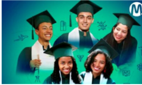
Ecopetrol lanza convocatoria abierta a los mejores bachilleres del país