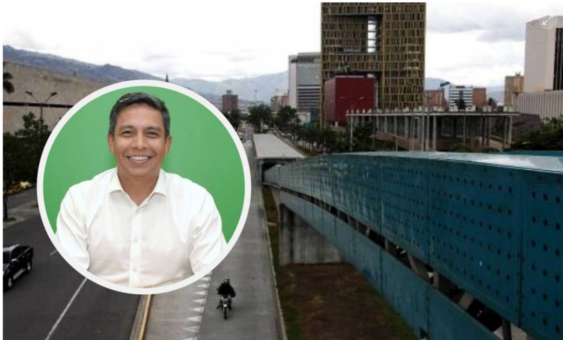
Teled Medellín estaría ad portas de una disolución en caso de que sus números también terminen en rojo en esta vigencia.